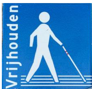
Figuur 5 de blauwe tegel: Houd de lijn vrij

Maar met het ondertekenen zijn wij als GRV er nog niet, dit is een beginpunt. Dus er is werk aan de winkel. De GRV moet blijven werken aan de bewustwording van iedereen in Venlo op gebied van toegankelijkheid.