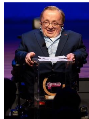
Figuur 4 Rick Brink

Met Gastspreker Rick Brink (oud-minister van Gehandicaptenzaken) die een zeer boeiende workshop gaf over leven en werken met een beperking. Verder waren er interessante workshops, een informatie en netwerkmarkt, lekkere hapjes en een drankje voor de aanwezigen