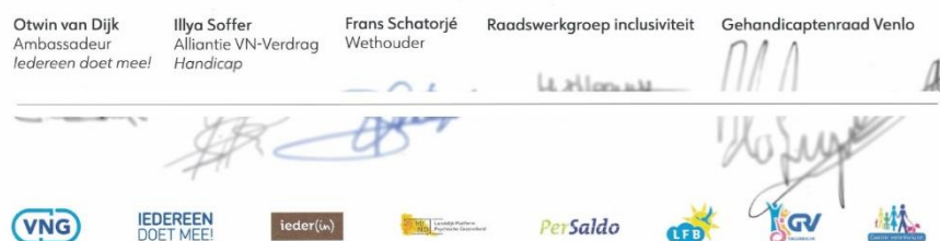
Figuur 2 Het getekende Manifest

Wij willen een echte inclusieve gemeente zijn, voor mensen met en zonder handicap, beperking of psychische kwetsbaarheid. Met het ondertekenen van dit manifest, laten we onze inwoners zien dat we hieraan werken, hierin willen leren en zo stap voor stap de doelen in het VN-Verdrag waarmaken.